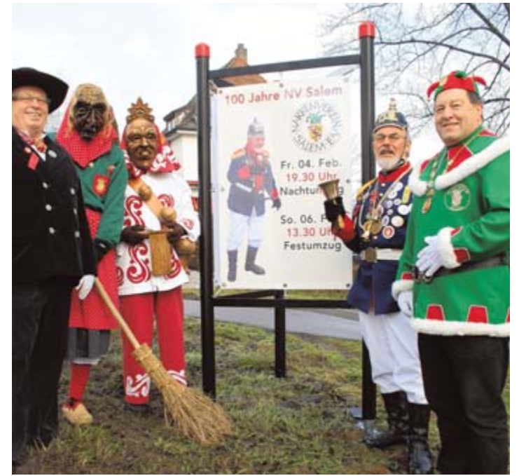
An allen Ortseingängen künden Stelen vom großen Jubiläum des Narrenvereins Salem. BILDER: AS

kann es schon auch mal vorkommen, dass ein Kanaldeckel gelupft und in die anrührliche Unterwelt geleuchtet wird. 1971 scharten sich einige Zunftmitglieder um Karl Ehrmann und riefen die Salemer Feuerhexen ins Leben. 1976 wurde eine weitere Maskengruppe geschaffen: die Fassköpfe. Sie haben einen historischen Hintergrund. Zu Klosterzeiten haben die Salemer Mönche ihre Weinfässer oft mit geschnitzten Menschenköpfen