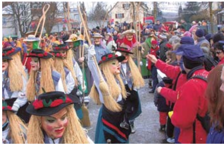
Salem ist für ein großes Narrenjubiläum gerüstet. Am Sonntagnachmittag werden über 4000 Hästräger erwartet.

wenn der große Aufmarsch der Narren steigt, auch das Wahrzeichen der alemannischen Fastnacht nicht fehlt, wird am morgigen Samstagnachmittag der Narrenbaum gestellt. Dem närrischen Aefanz geben sich die Salemer schon weit länger als seit 100 Jahren hin. Im Narrenschopf des Geburtstagskindes hängt das älteste vorhandene Bilddokument. Es stammt aus dem Jahr 1895 und zeigt eine Zigeunergruppe, wie sie für den Fotografen an illustrem Ort posiert: